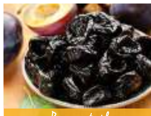
Pruneaux et miel