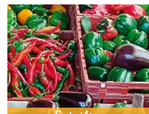
Fruits et légumes