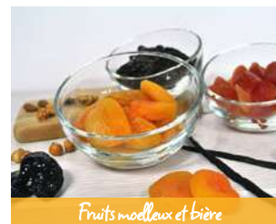
Fruits moelleux et bière