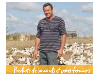
Produits de canards et porcs fermiers

Toute l'année, vente sur les marchés de Lauzun, Monflanquin, Villereal, Issigeac, Castillonès, Cancon, Miramont-de-Guyenne, Villeneuve-sur-Lot, Eymet et Bergerac.