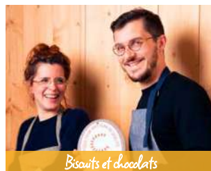
Biscuits et chocolats