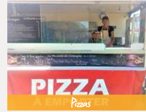
PIZZA A EMPIER PIZZAS

Le mercredi, vendredi et samedi de 8h30 à 14h et à partir de 18h.