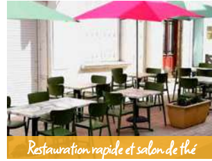
Restauration rapide et salon de thé

Le mardi de 12h à 14h. Du mercredi au samedi de 12h à 14h et de 18h30 à 21h30.