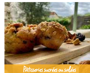
Pâtisseries sucrées ou salées